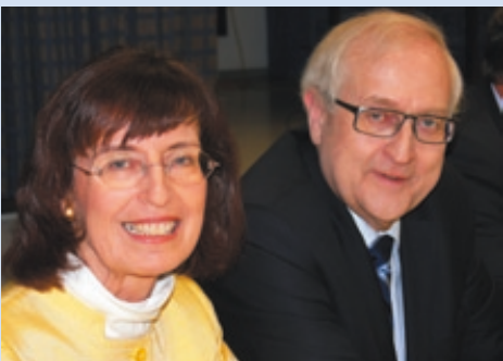
Uta Schellhaas MdL mit Bundes- wirtschaftsminister Rainer Brüderle MdB im Gespräch.